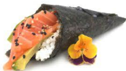
601. Temaki Salmone Salmone crudo ed avocado