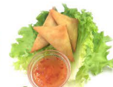
3. Involtini Tai 3pz Ripieno di verdure e curry