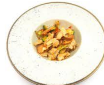
48. Gnocchi di riso con verdure e pollo € 6.50