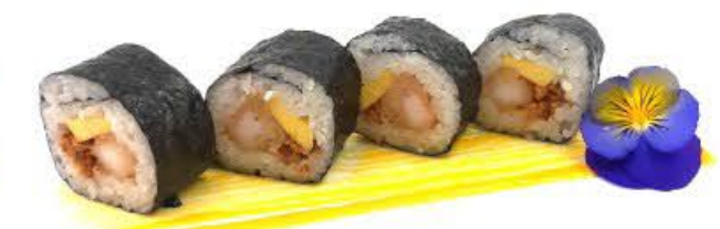
504. Futo Style 4pz Gamberi fritti, mango e cipolla frita €8.00