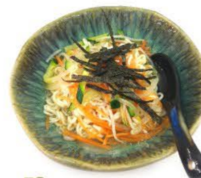
50. Zuppa con spaghetti e verdura mista