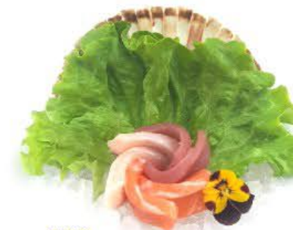
800. Sashimi Misto 6pz