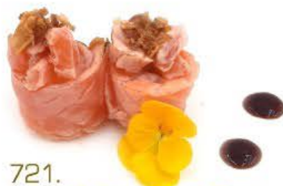
721. Hana Sake flambé 2pz Riso, salmone scottato, salsa barbecue e cipolla fritta