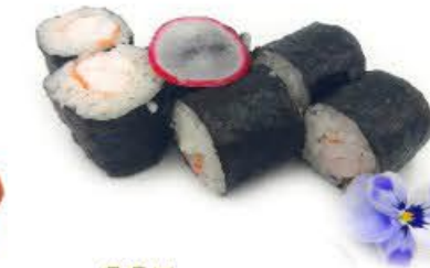
305. Hoso Ebi 6pz Gamberi cotti € 5.00