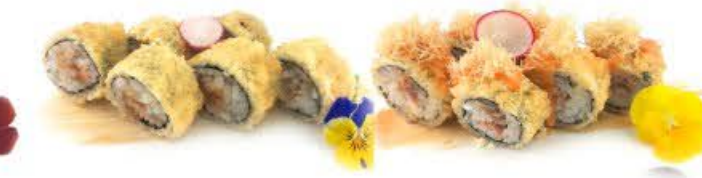
311. Hoso Sake fritto 6pz Salmone con salsa giapponese € 7.00