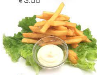
6. Patatine fritte