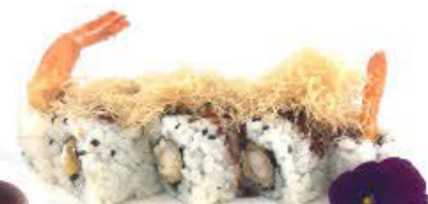
404. Ura Ebiten 8pz Gamberi fritti, kataifi, salsa teriyaki e maionese €9.00