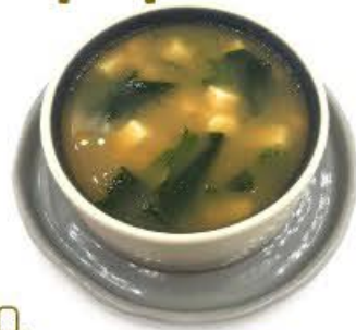
30. Zuppa di Miso (Giapponese) Alghe con tofu (formaggio di soia) € 4.00