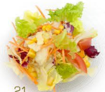
21. Insalata mista € 4.50