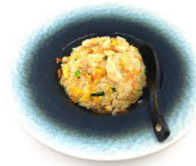
41. Riso con pollo e verdure € 5.50