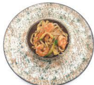
63. Udon saltato con verdura mista e gamberi