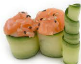
726. Hana Kappa Sake 2pz Riso, cetrioli e salmone