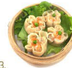
13. Ebi shumai 4pz Ravioli con ripieno di gamberi*, verdure e carne 4pz.