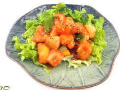
76. Pollo in salsa agrodolce Pollo con peperoni, ananas, pomodori e salsa agrodolce