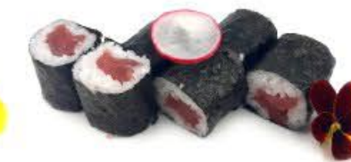
302. Hoso Maguro 6pz Tonno crudo € 6.00