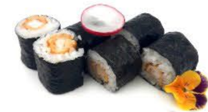
306. Hoso Ebi fritti 6pz Gamberi fritti € 5.50