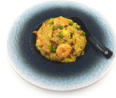
45. Riso al curry Riso con prosciutto cotto, piselli e gamberi* € 6.00