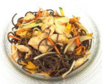
65. Soba grano (senza glutine) saltato con verdura mista e pollo