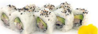
406. Ura Tonno 8pz Tonno cotto, avocado e Philadelphia €9.50