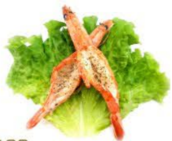
126. Gamberoni alla griglia 2pz Max 1 porzione € 7.00