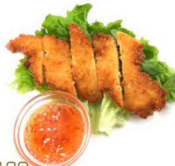
130. Tempura di pollo € 8.00