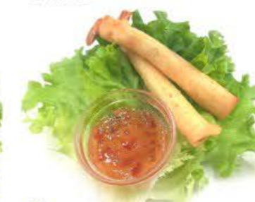
5. Involtini di gamberi fritti 2pz Ripieno di gamberi e cipollotti