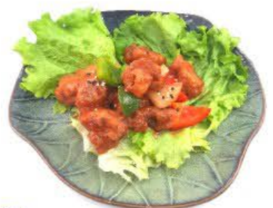
86. Maiale in salsa agrodolce Peperoni, ananas, pomodori e salsa agrodolce