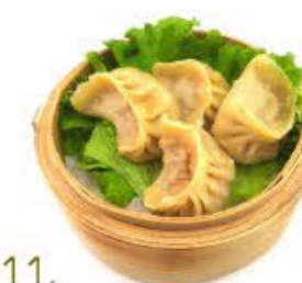
11. Ravioli di verdure e carne al vapore 4pz