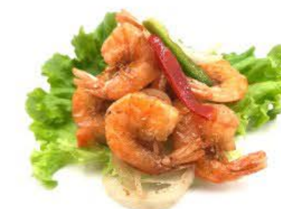
108. Gamberi sale e pepe