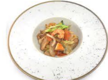
49. Gnocchi di riso ai frutti di mare Gamberi, polpo, surimi e verdure € 7.00