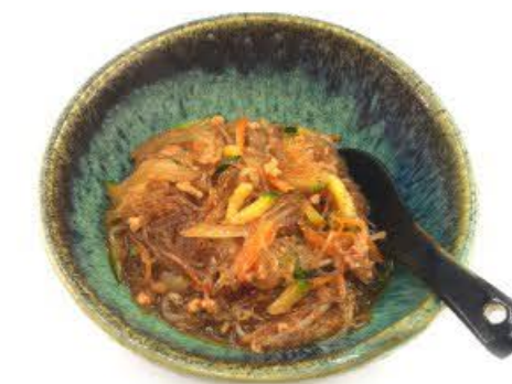
58. Spaghetti di soia in brodo con verdura mista e carne