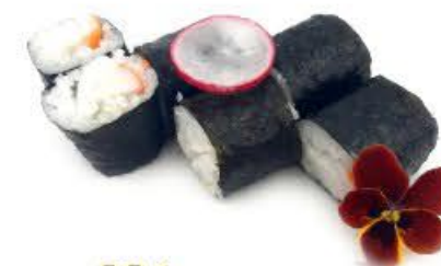
304. Hoso California 6pz Surimi di granchio € 4.50