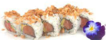
405. Ura Cipolla tritata 8pz Salmone crudo, avocado, Philadelphia e cipolla tritata €9.00