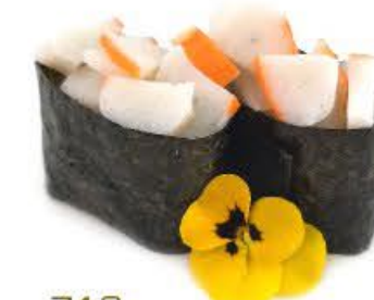
713. Gunkan Surimi 2pz Riso, granchio e salsa giapponese