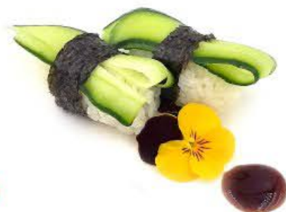
213. Nigi kappa 2pz Cetriolo € 3.00