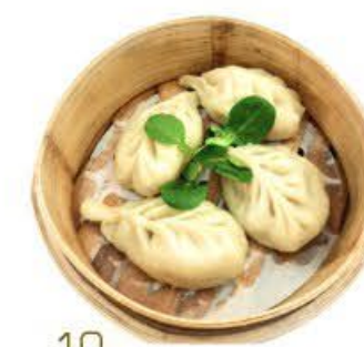
10. Ravioli di verdure al vapore 4pz