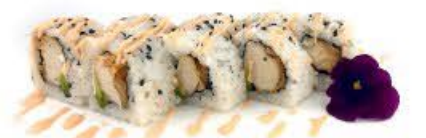
410. Ura Chicken chop 8pz Pollo fritto, avocado e salsa rosa €10.00