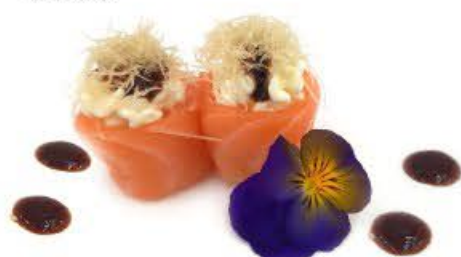
725. Hana Kataifi 2pz Riso, salmone, Kataifi e Philadelphia