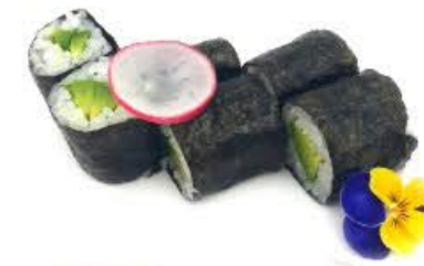
307. Hoso Avocado 6pz € 4.50