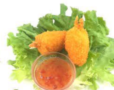
2. Chele di granchio 2pz