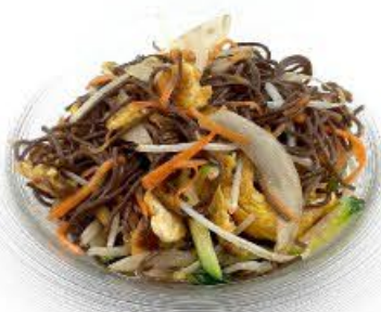
64. Soba grano (senza glutine) saltato con verdura mista