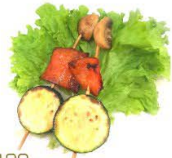
120. Spiedini di verdura mista 2pz € 4.50