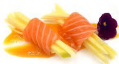
905. Involtini Fruit Salmone, mango e salsa mango