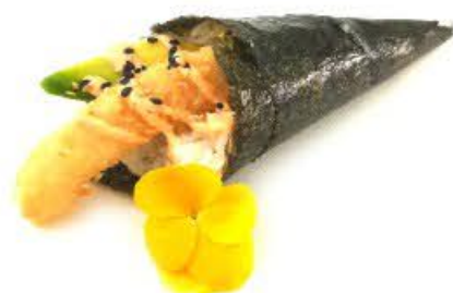
604. Temaki Ebi fritti Gamberi fritti, avocado e salsa rosa