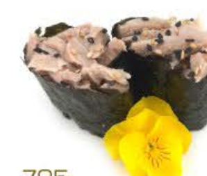
705. Gunkan Tonno cotto 2pz Riso, tonno cotto e salsa Giappone