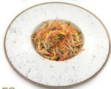
53. Spaghetti di riso con verdura mista