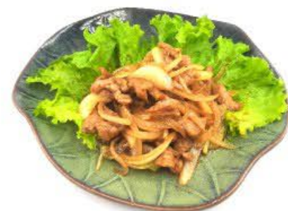
92. Vitello con cipolla