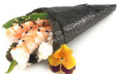
603. Temaki Gamberi Gamberi cotti ed avocado