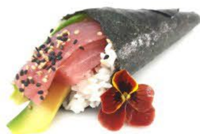
602. Temaki Tonno Tonno crudo ed avocado