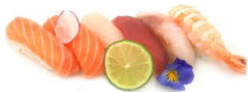
200. Nigi Misti 6pz € 8.50