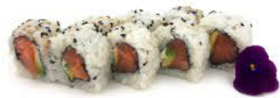
401. Ura Sake 8pz Salmone crudo, avocado e Philadelphia €8.50