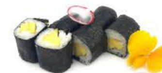
309. Hoso Mango 6pz € 5.50