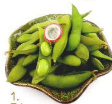
1. Edamame Fagiolini di soia verde