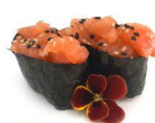
701. Gunkan Sake 2pz Riso, salmone crudo e salsa Giappone