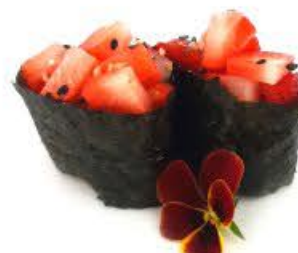
708. Gunkan Berry 2pz Riso e fragola Solo in stagione