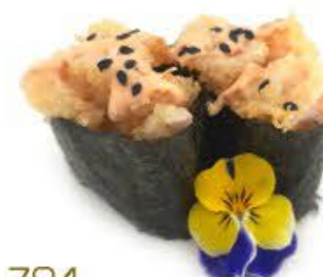
704. Gunkan Gamberi 2pz Riso, gamberi fritti e salsa rosa