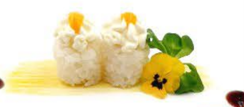
729. Hana Simple 2pz Riso, Philadelphia e salsa mango