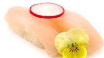
203. Nigi kajimaguro 2pz Pesce spada € 4.00