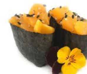
707. Gunkan Mango 2pz Riso, mango e salsa mango