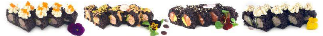
412. Ura Fiocco di neve 8pz Pesce spada, avocado, Philadelphia e tobiko €11.00