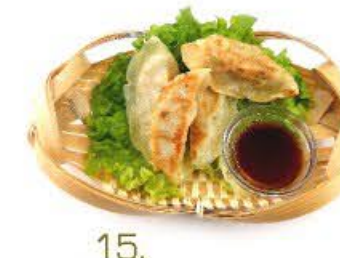
15. Ravioli di pollo giapponese alla griglia 4pz