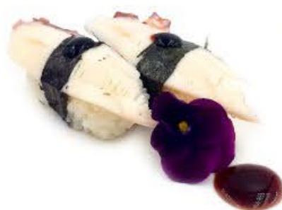
212. Nigi Takko 2pz Polpo € 3.50