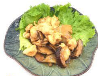
71. Pollo con bambù e funghi