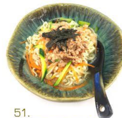
51. Zuppa con spaghetti, verdura mista e carne piccante