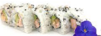
406A. Ura Salmone 8pz Salmone fritto, avocado e Philadelphia €9.00