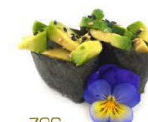
706. Gunkan Avocado 2pz Riso, avocado e salsa Giappone