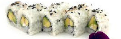
407. Ura Green 8pz Mango, avocado e Philadelphia €8.00