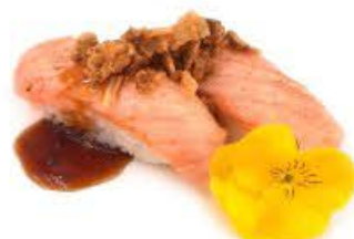
207. Nigi Sake flambé 2pz Salmone scottato con Salsa barbecue e cipolla fritta € 4.00