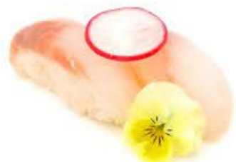
204. Nigi Suzuki 2pz Branzino € 3.50