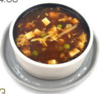
33. Zuppa agropiccante Zuppa con tofu (formaggio di soia), prosciutto cotto e piselli € 5.00