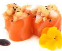
724. Hana Ebi fritti 2pz Riso, salmone e gamberi fritti