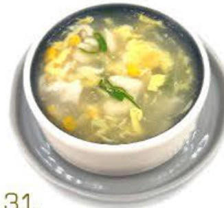
31. Zuppa con pollo e mais € 5.00