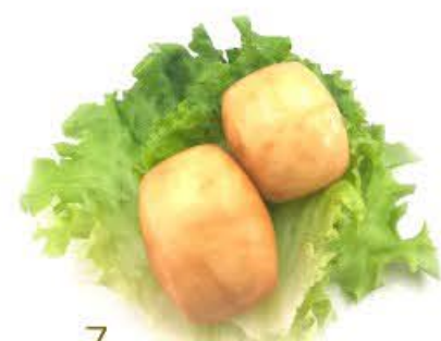
7. Pane cinese fritto 2pz Pane al latte