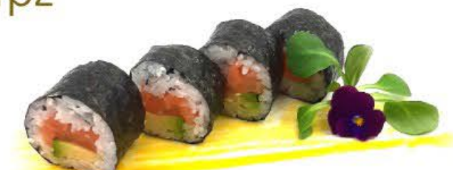
502. Futo Sake 4pz Salmone ed avocado €8.00