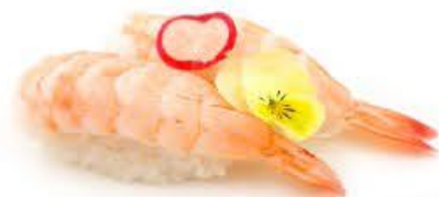
205. Nigi Ebi 2pz Gamberi cotti € 3.50