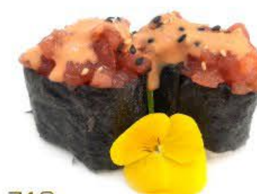
712. Gunkan Maguro Spicy 2pz Riso, Tonno e spicy