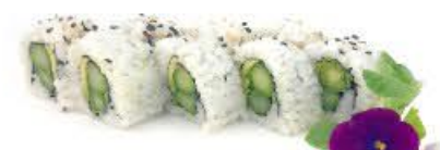
408. Ura Veggy 8pz Vegetariano misto €8.00