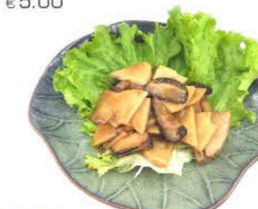
116. Funghi e bambù (cinese)