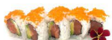
409. Ura Tobiko 8pz Salmone, avocado, uova di pesce e Philadelphia €10.00