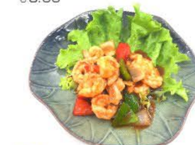
104. Gamberi con salsa piccante Peperoni, cipolle e arachidi