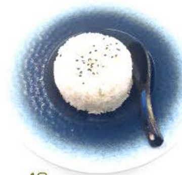
40. Riso in bianco € 2.00