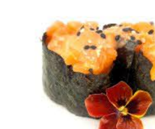
711. Gunkan Sakè Spicy 2pz Riso, Salmone e spicy