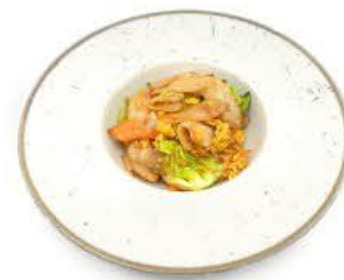
46. Gnocchi di riso con verdure miste € 6.00