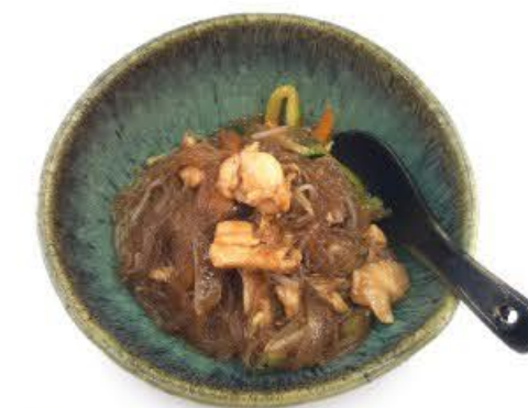
59. Spaghetti di soia in brodo con verdure e pollo