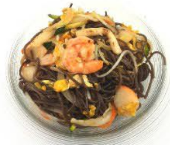
66. Soba grano (senza glutine) saltato con verdura mista e frutti di mare