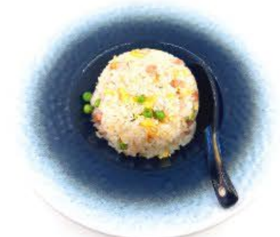
43. Riso alla cantonese € 5.50