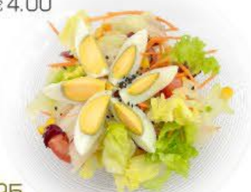
25. Insalata con uova Insalata con uova sode, pomodoro e mais € 6.00