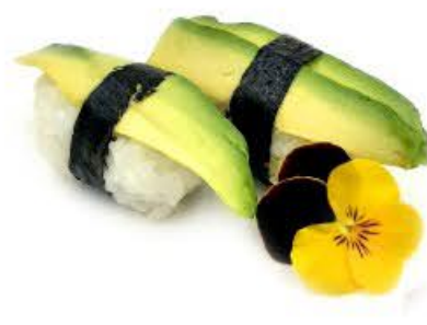
214. Nigi avocado 2pz € 3.50