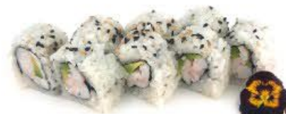
403. Ura Ebi 8pz Gambero cotto, avocado e Philadelphia €8.00