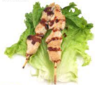
122. Spiedini di pollo 2pz € 6.00