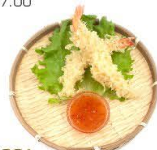
133A. Tempura mista Verdure e gamberi € 5.00