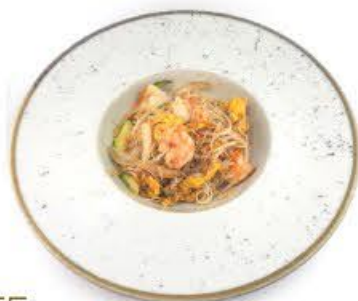
55. Spaghetti di riso con verdura mista e frutti di mare