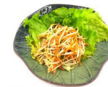
117. Germogli di soia