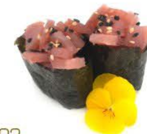
702. Gunkan Maguro 2pz Riso, tonno crudo e salsa giapponese