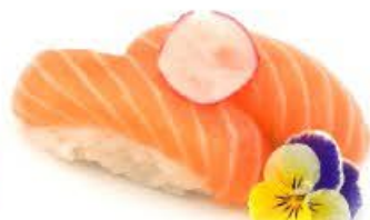
201. Nigi Sake 2pz Salmone € 3.50