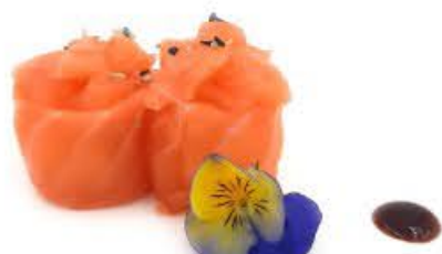
720. Hana Sake 2pz Riso e salmone