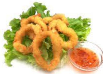
131. Tempura di seppie € 7.00