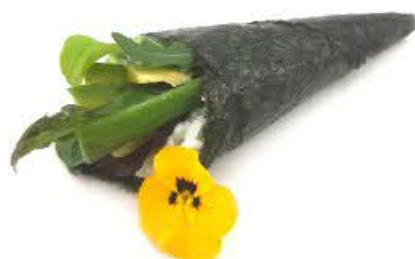
606. Temaki Veggy Cetriolo, avocado, insalata mista e salsa teriyaki