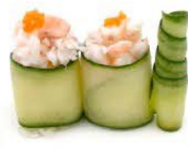
728. Hana Kappa Ebi 2pz Riso, cetriolo, gamberi cotti e tobiko