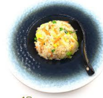
40a. Riso con verdure € 5.00