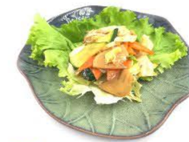
115. Verdura mista saltata