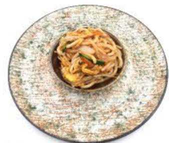
60. Udon saltato con verdura mista