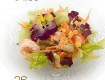
26. Insalata Ebi Insalata con gamberi *cotti € 6.00