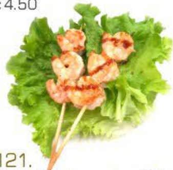
121. Spiedini di gamberi 2pz € 6.50