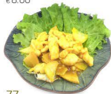
77. Pollo al curry Pollo con cipolla, bambù e salsa al curry