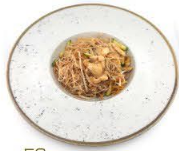
56. Spaghetti di riso con verdura mista e pollo