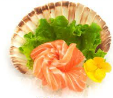
801. Sashimi Sake Salmone