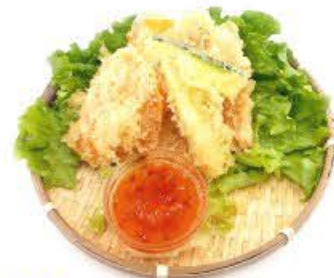
132. Tempura di verdure € 7.00