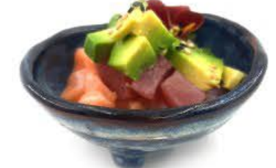
742. Tartare Misto Salmone, tonno crudo, avocado e salsa giapponese