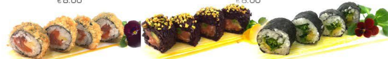
505. Futo Sake fritti 3pz Salmone, formaggio (emmentaler) e salsa piccante €8.00