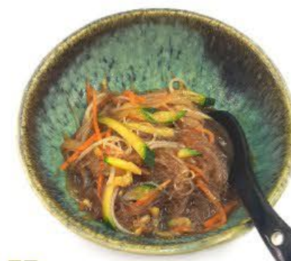
57. Spaghetti di soia in brodo con verdura mista