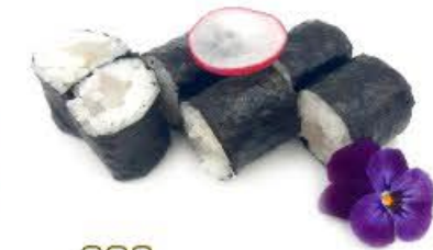
303. Hoso Kajimaguro 6pz Pesce spada crudo € 5.50