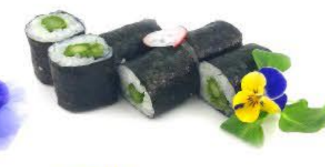
308A. Hoso Asparagi 6pz € 4.50