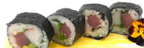
501. Futo California 4pz Tonno crudo, avocado, surimi e insalata €8.00