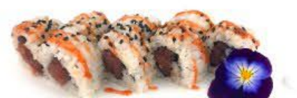
402A. Ura Maguro Spicy 8pz Tartare di tonno e spicy €9.50