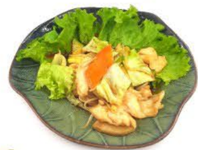
70. Pollo con verdura mista