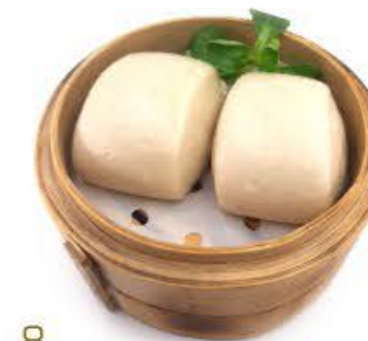
8. Pane cinese al vapore 2pz Pane al latte