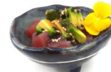
741. Tartare Maguro Tonno crudo, avocado e salsa giapponese