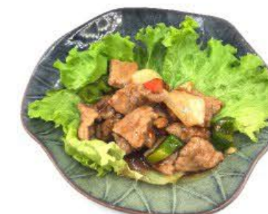
94. Vitello con salsa piccante Peperoni, cipolle e arachidi