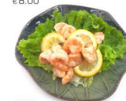
103. Gamberi al limone