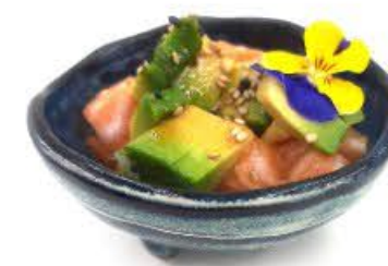
740. Tartare Sake Salmone crudo, avocado e salsa giapponese