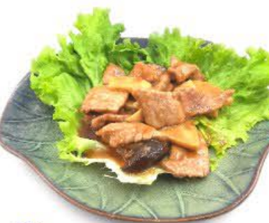
91. Vitello con funghi e bambù