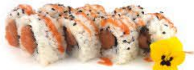
401A. Ura Sakè Spicy 8p Tartare di salmone e spicy €9.00