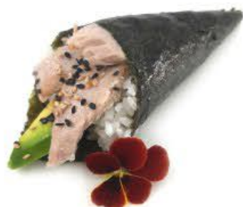
605. Temaki Tonno cotto Tonno cotto ed avocado