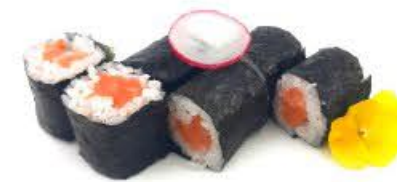
301. Hoso Sake 6pz Salmone crudo € 5.50