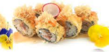
312. Hoso Sake roll fritto 6pz Salmone, formaggio (Emmentaler), kataifi e salsa piccante € 8.00