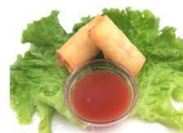
4. Involtini primavera 2pz Ripieno di verdure.