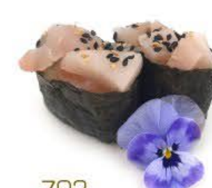
703. Gunkan Kajimaguro 2pz Riso, pesce spada e salsa Giapponese