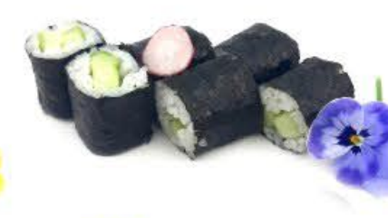
308. Hoso Kappa 6pz Cetriolo € 4.00