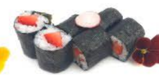
310. Hoso Berry 6pz Fragola Solo in Stagione € 5.00