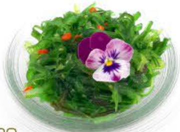
20. Goma wakame Alghe verdi piccanti € 4.00