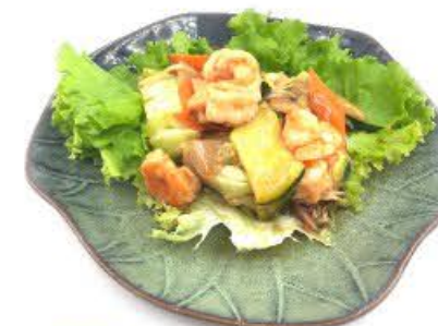
100. Gamberi con verdure miste