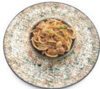
62. Udon saltato con verdura mista e pollo