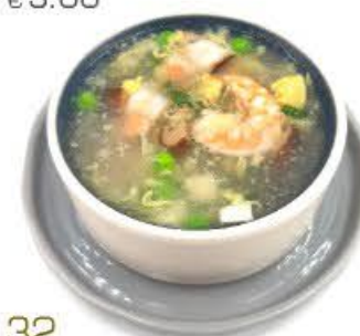
32. Zuppa cinese Zuppa con tofu (formaggio di soia), prosciutto cotto, gamberi, piselli e funghi € 5.00