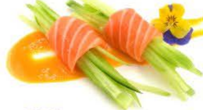
906. Involtini Veggy Salmone, cetriolo e salsa mango