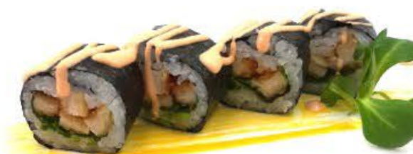
503. Futo Smile 4pz Chikin chop, insalata e salsa rosa €8.00