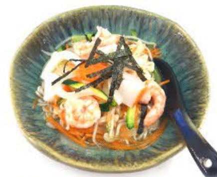
52. Zuppa con spaghetti, verdura mista e frutti di mare*