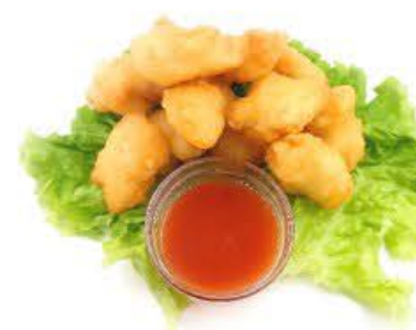
135. Pollo fritto