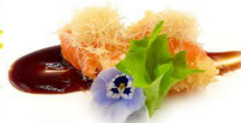
907. Involtini Ebi Salmone, tempura gamberi, teriyaki e kataifi